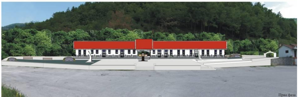
Идејно рјешење уређења комплекса цркве Св. Борфа Доња Сопотница-Ново Горажде ЦРКВЕНИ ДОМ Аутор: Мимо Тамбурић - Јан. 2018.