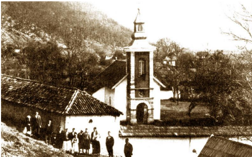
Изглед цркве и одаја пред Други свијетски рат