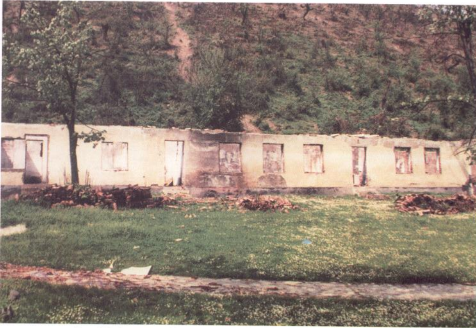
Сл. 27. Зидине “конака”, снимљено са јужне стране