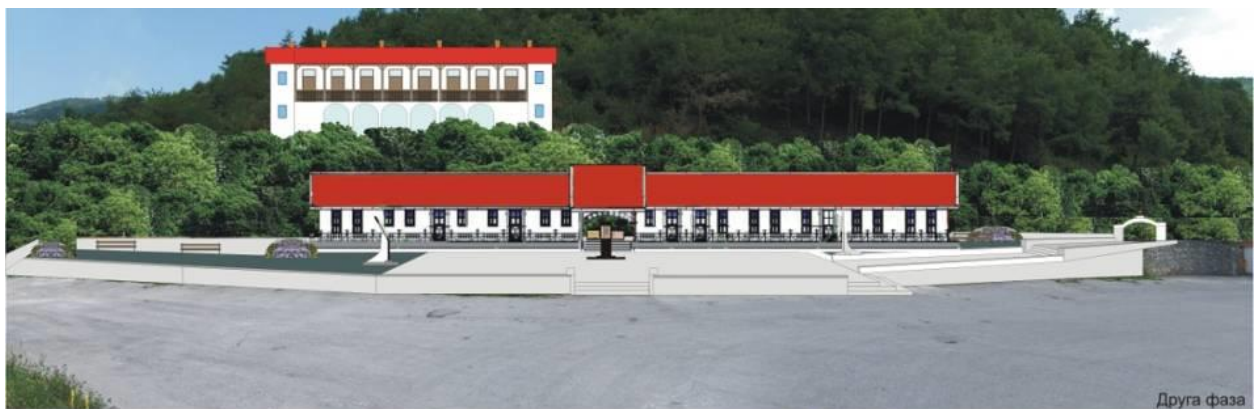
Идејно рјешење уређења комплекса цркве Св. Борфа Доња Сопотница-Ново Горажде ЦРКВЕНИ ДОМ Аутор: Мимо Тамбурић - Јан. 2018.