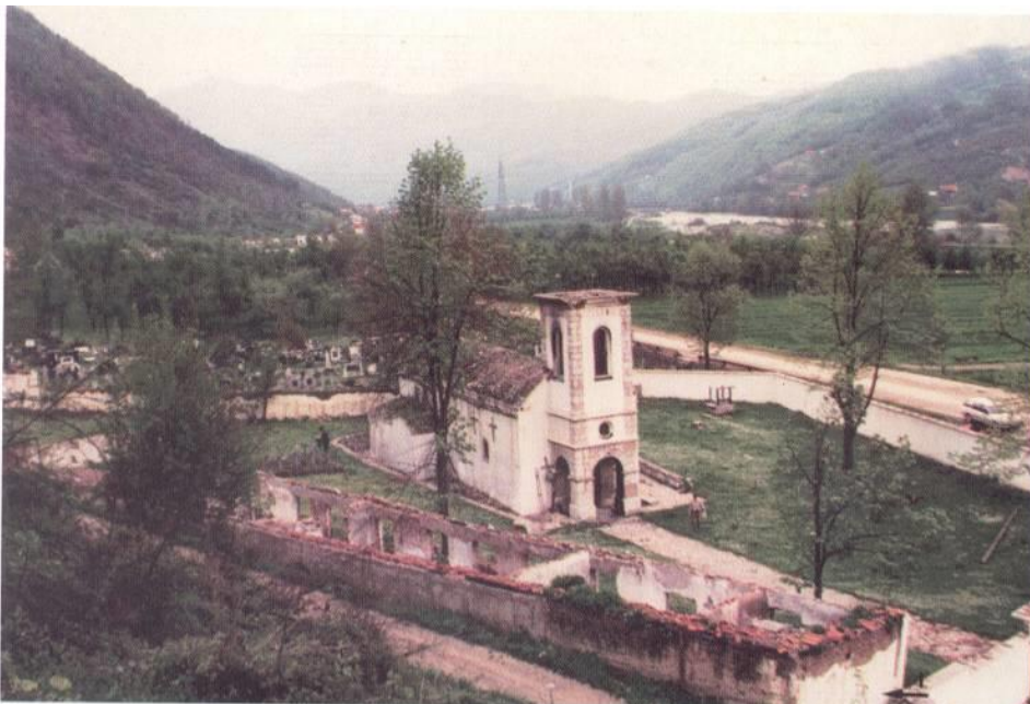
Изглед разрушених црквених одаја и цркве Св. Ђорђа 1994.године...