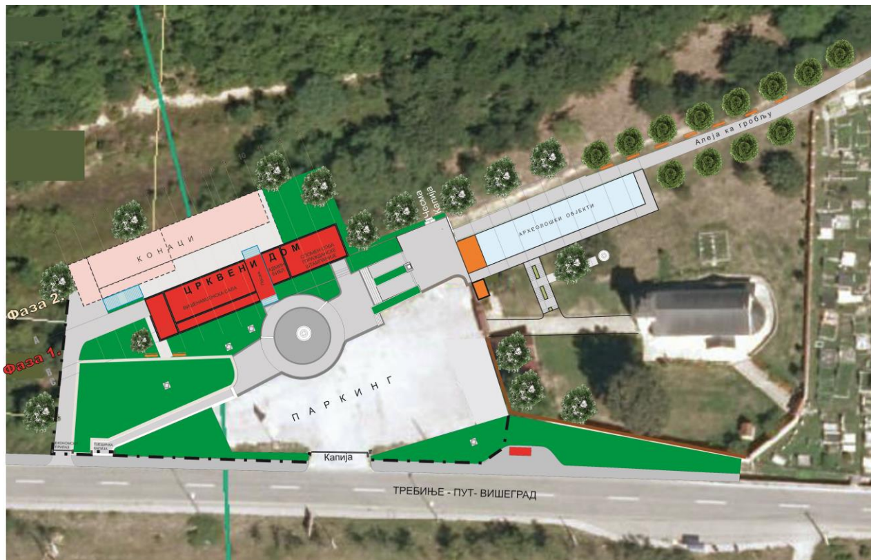
Идејно рјешење уређења комплекса цркве - лоцирање објеката

Објекат Црквеног дома који би садржавао у једном дијелу вишенамјенску салу (за окупљања поводом парастоса, вјенчања, крштења и др.), а у другом: библиотеку и салу за изложбе, промоције, презентације (спомен салу горажданске штампарије) и реплику старе горажданске штампарије, био би лоциран на падини изнад паркинга и изнад платоа који би се уредио за одржавање традиционалних културних манифестација и приредби на отвореном простору и служио као прилаз новопроектваном објекту. Даље на падини би фазно могли да се изграде и објекти са другим садржајима (конач са смјештајним, угоститељским и др. услугама).